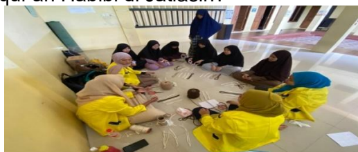
Gambar 1. Kegiatan Survey Kelompok KKN 17

Pada penelitian (Muazaroh & Subaidi, 2019) menjelaskan perspektif teori maslow dalam memahami manusia secara menyeluruh di antaranya adalah: Pertama, manusia adalah individu yang terintegrasi penuh. Kedua, karakteristik dorongan atau kebutuhan yang muncul tidak bisa dilokasikan pada satu jenis kebutuhan tertentu. Ketiga, kajian tentang motivasi harus menjadi bagian dari studi tentang puncak tujuan manusia.Keempat, teori motivasi tidak dapat mengabaikan tentang kehidupan bawah sadar. Kelima, keinginan yang mutlak dan fundamental manusia adalah tidak jauh dari kehidupan sehari-harinya. Keenam, keinginan yang muncul dan disadari, seringkali merupakan pencetus dari tujuan lain yang tersembunyi. Ketujuh, teori motivasi harus mengasumsikan bahwa motivasi adalah konstan dan tidak pernah berakhir, dan masih ada beberapa konsep dasar lainnya. Dari analisis potensi yang dipaparkan di atas, pengabdian ini menjawab rumusan masalah utama sebagai berikut: Bagaimana pelaksanaan pendampingan upaya meningkatkan skill santri melalui pelatihan jemari tali dan fotografi pada pondok pesantren sahabat qur'an Habibi di Jatiasih?