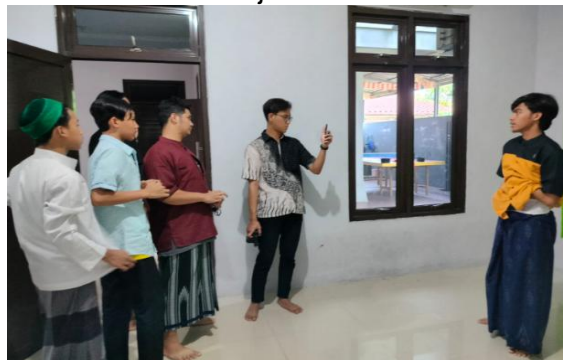
Gambar 3. Penentuan Kegiatan yang dibutuhkan oleh Santri

barang yang tadinya dikonsumsi karena motivasi keinginan, pada tingkat keadaan ekonomi lebih baik, barang tersebut telah berubah menjadi kebutuhan